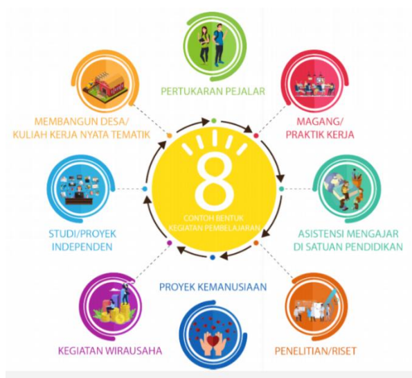
Gambar 10.1. Bentuk Kegiatan Pembelajaran MBKM